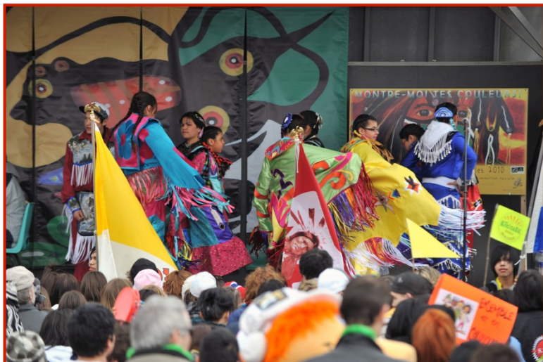
Ouverture traditionnelle avec les tambours Screaming Eagle et les danseurs du Lac-Simon.